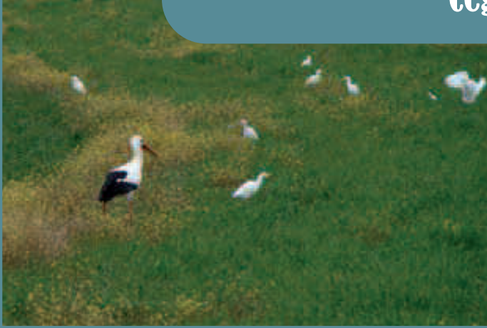
Cigüeñas y garcillas