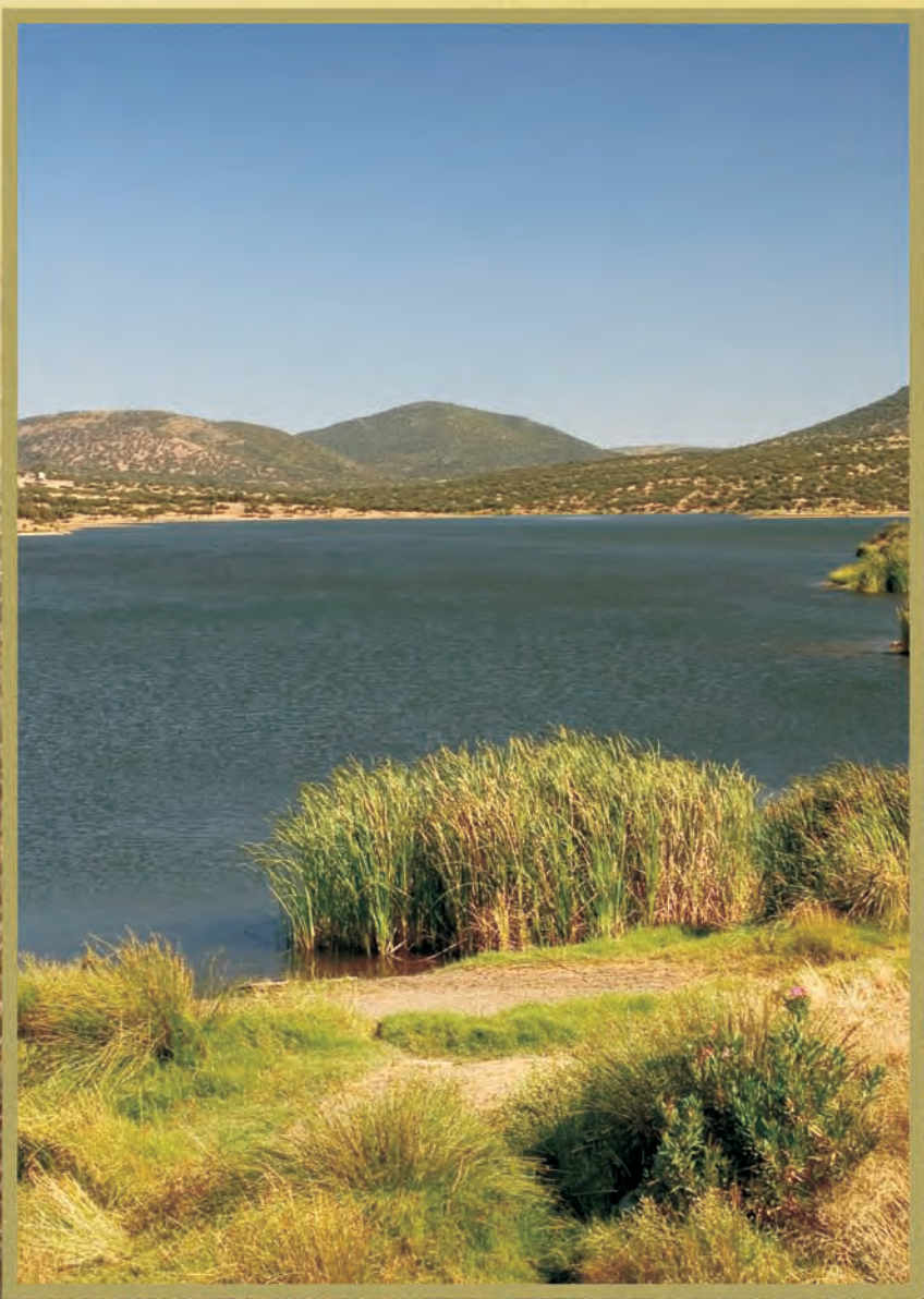
CORREDORES ECOFLUVIALES DE LA PROVINCIA DE BADAJOZ

RUTA: "PRESA DE NOGALES" NÚCLEO DE REFERENCIA: Nogales RIO EJE: Riviera de Nogales LONGITUD: 22,810 km DURACIÓN: 5 horas DIFICULTAD: Baja CARACTERÍSTICAS: En nuestro recorrido hacia el valle, podremos visitar la Ermita de origen romano "Camino a Barcarrota", junto a la que encontramos elementos de esta época como una antigua lápida de mármol. Nos adentraremos en las dehesas de bosque mediterráneo que marcan estos lugares bañados de historia, además de conocer ecosistemas acuáticos artificiales donde haremos una parada en el observatorio de aves y disfrutar de la riqueza faunística de este lugar.