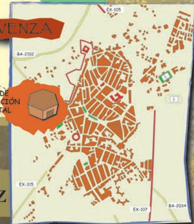
CORREDORES ECOFLUVIALES DE LA PROVINCIA DE BADAJOZ