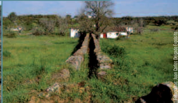
Molino La Parra